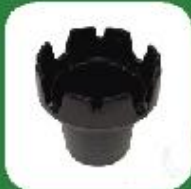
Ashtray Drop in