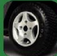
10-Inch Aluminum Alloy Wheels