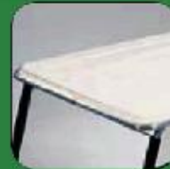
Canopy Top White and Beige