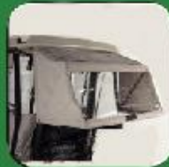
Golf Bag Cover